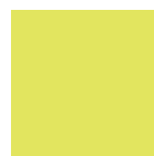
GIALLO RAL 1016