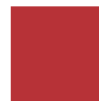
ROSSO tipo RAL 3002