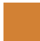
ARANCIO RAL 2003